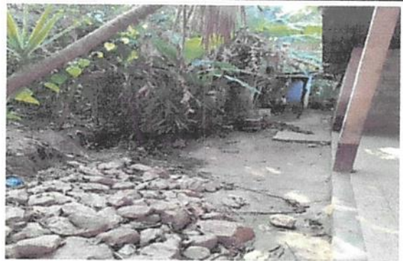
Foto 2: Construcción de cerca con malla galvanizada 2 mts de alto y tubo galvanizado 1 1/2" con su respectivo bordillo y alambre de púa.