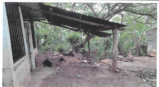
Foto 4: Sustitución de madera por estructura de metal, costanera tipo C de 2X3" con tubo de 4X2" y lamina troquelada calibre 26, en área de cocina.