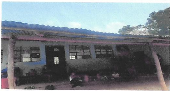
Foto 3: Sustitución de madera por estructura de metal, costanera tipo C de 2X3" con tubo de 4X2" y lamina troquelada calibre 26, en área de patio.